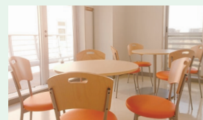
リフレッシュルーム