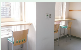
リフレッシュコーナー

SIC-1の3階リフレッシュルームの家具を入れ替えました!お昼休憩などにご利用ください。またSIC-2の各階リフレッシュコーナー・キッチンラボ、SIC-3の3階食堂も同様にご利用ください。