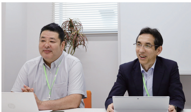
松尾プロデューサー