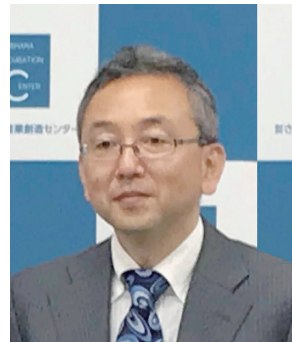
TAMA協会 芳賀事務局長も Desk10会員として登録いただいています

企業を取り巻く環境や求められる知見や、ノウハウが目まぐるしく変化する中、TAMA協会とSICは地域経済に好循環を生み出すための活動に邁進していきます。