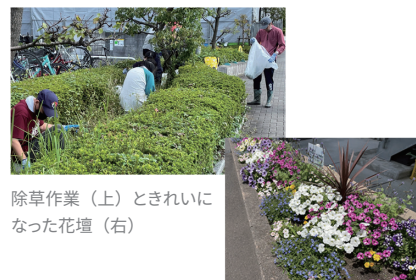
除草作業(上)ときれいになった花壇(右)

SDGsは「世界中の誰もが幸せに暮らし続けることができる世界の実現」を目指し、一人ひとりができることから取り組んでいくものです。SICの本業でもある中小・ベンチャー企業の新技術・新製品開発への支援活動は「9 産業と技術革新の基盤をつくろう」と直結しています。さらに自治体や産業支援機関、金融機関との連携による入居企業・地域の研究開発の後押しは幅広い展開へと広がっています。足元からの行動とより良いパートナーシップを育みながら、SICは未来志向の活動を続けてまいります。