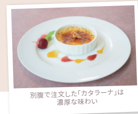
別腹で注文した「カタラーナ」は濃厚な味わい