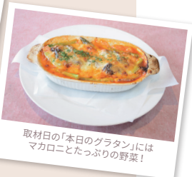
取材日の「本日のグラタン」にはマカロニとたっぷりの野菜!