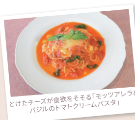
とけたチーズが食欲をそそる「モッツアレラとバジルのトマトクリームピスタ」

旬を意識した料理とともに、相模川のようにゆったりとした時間をお過ごしください。(佐藤)