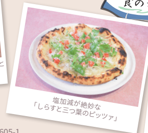
塩加減が絶妙な「しらすと三つ葉のピッツァ」