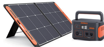
SICで購入した太陽光パネルとポータブル蓄電池

SICスタッフの発案から「100%再生可能エネルギー」を活用した気候変動の抑制にも貢献しています。太陽光パネルとポータブル蓄電池、モバイルバッテリーをSICで購入。屋上で充電した電力はモバイルバッテリーに分けて、館内に設置しているスピーカーの電源として利用し、入居企業の皆様への貸し出しも行っています。