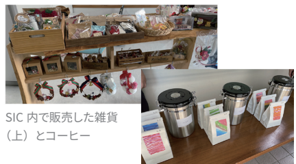
SIC内で販売した雑貨(上)とコーヒー

や花壇の管理を行っています。ハンディキャップのある方や生活に困窮する方たちが作った雑貨やコーヒー豆、野菜の販売を行ったり、市内社会福祉団体様主催の「障害福祉サービス事業者職員向け『工賃アップセミナー』」ではSICのスタッフが講師として事例の紹介を行いました。福祉団体様等との連携を希望される事業者様には、SICが個別の引き合わせをコーディネートして、パートナーの輪を広げています。