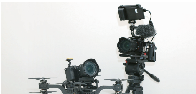
カメラを搭載したドローンと、専用の撮影機材

しかし、映像全体を構成する上でドローン空撮だけに固執せず、案件の特性に合わせて最適な映像制作を提案しています。